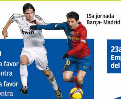
15a jornada Barça- Madrid