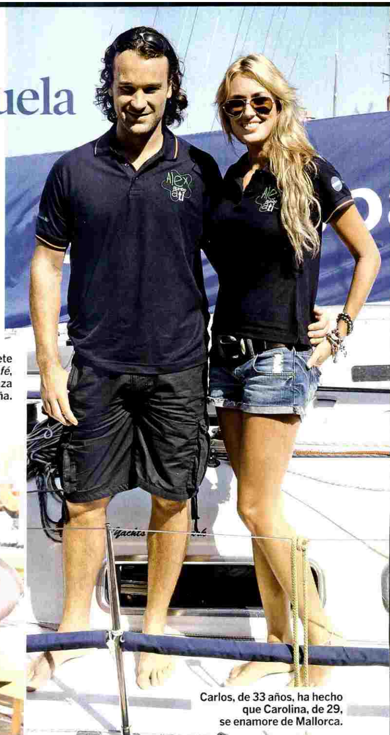
Carlos, de 33 años, ha hecho que Carolina, de 29, se enamore de Mallorca.

C ÓMPLICES se mostraron el mallorquín Carlos Moyá y la alicantina Carolina Cerezuela durante su visita al Club Náutico de Palma para apoyar la iniciativa Álex rumbo a ti , embarcación donde la mitad de sus regatistas tienen alguna discapacidad física.